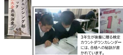
☆ 商業科:3週連続の簿記等の検定期間 全員の仲間と先生がワンチームになって最後までチャレンジします。