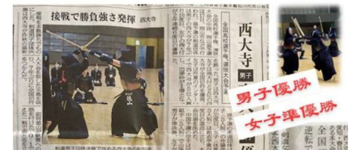
☆ 3月の全国選抜大会に、 剣道部、フェンシング部 ともに、男女でアベック 出場を決めました。 R8.1.18 山陽新聞