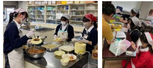
☆ さいさい子ども食堂「クリスマス会」にボランティア参加！ ポテトサラダのツリーやお菓子のツリーを作ったり、魚釣りゲームを企画 するなど、サンタの衣装を着て子どもたちと一緒に楽しみました。