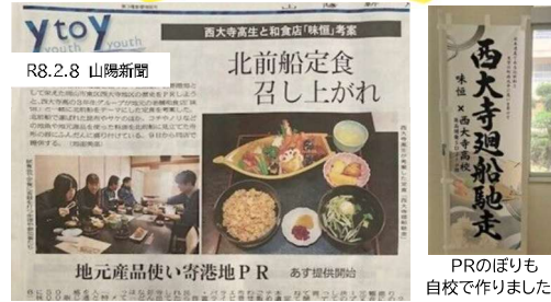
☆ 寿司割烹 味恒×西大寺高校で開発した定食「西大寺廻船馳走」