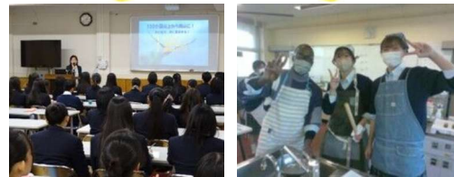
☆ 韓国の講師の方による「異文化理解講座」