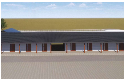
【最終完成予想図】 ※雨天練習場整備後