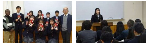
☆ 自分の体験や主張を英語で述べる「スピーチコンテスト」