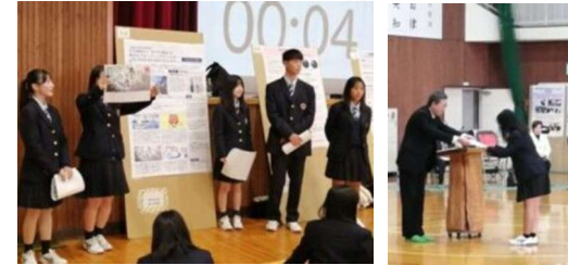
☆「探究プレゼンアワード」に2チーム出場！ 日の出醤油(有)の「あごだし醤油」を魅力的にするパッケージとは？を 発表したチームは準グランプリに輝きました！