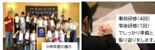
事前研修(4回) 事後研修(1回) でしっかり準備と 振り返りをします。