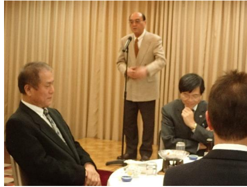
三枝同窓会長による挨拶