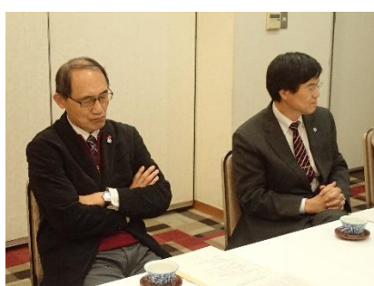
西大寺高校同窓会の活性化について意見交換が行われました。 平成30年度中に役員会で協議することを確認しました。