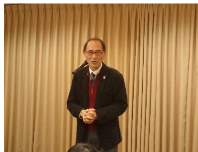
奥山副会長による閉会挨拶