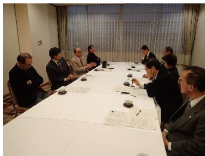
三善校長挨拶 学校の様子について報告がありました。