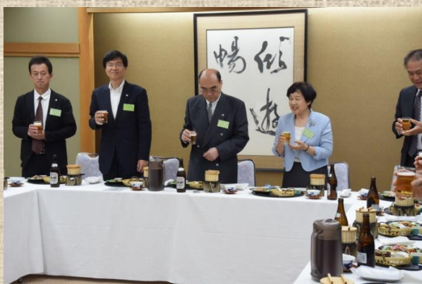
○ 森副会長による乾杯