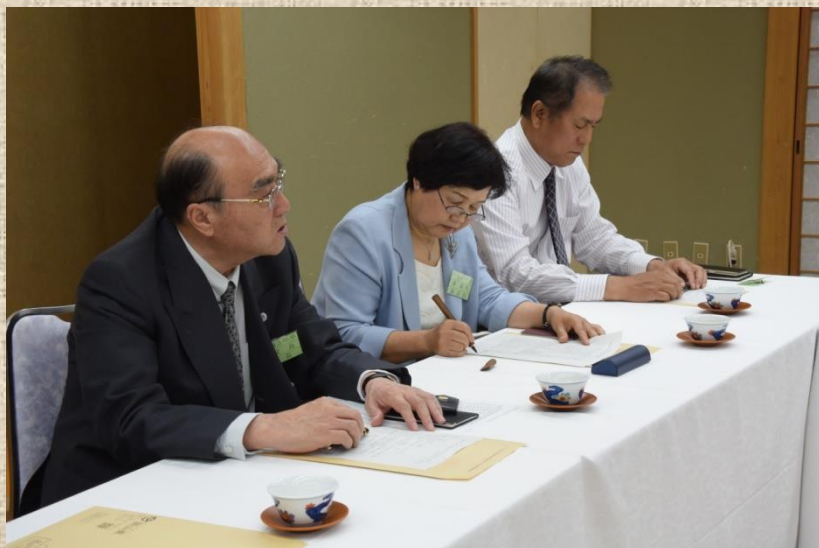
○ 協議題に関して議長を務める同窓会長