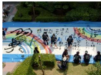
書道部によるパフォーマンス