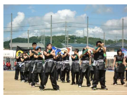
ブロックによる仮装の演技