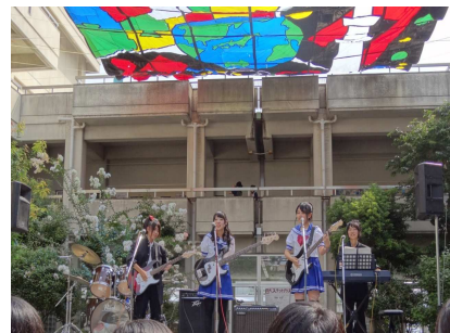
中庭特設ステージでのバンド演奏 ブロック制作による巨大スタンドグラスも見えます。