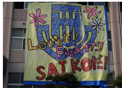
全校制作の「手形」による巨大壁画