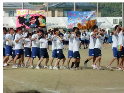
体育祭のフィナーレは 3年生全員によるフォークダンス♪