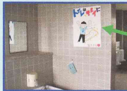
トイレに掲示されたポスター