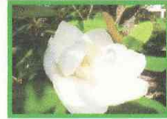
時計台付近に大山蓮華という花が咲いていました。とても大きな花でした。(花の直径20cmくらい)6/28