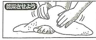
指の間に水分が残らないよう十分ふき取りましょう。