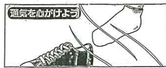
長時間靴を履き続ける時は、時々風を通しましょう。