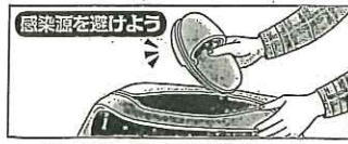
ほかの人との履物の共有は避けましょう。